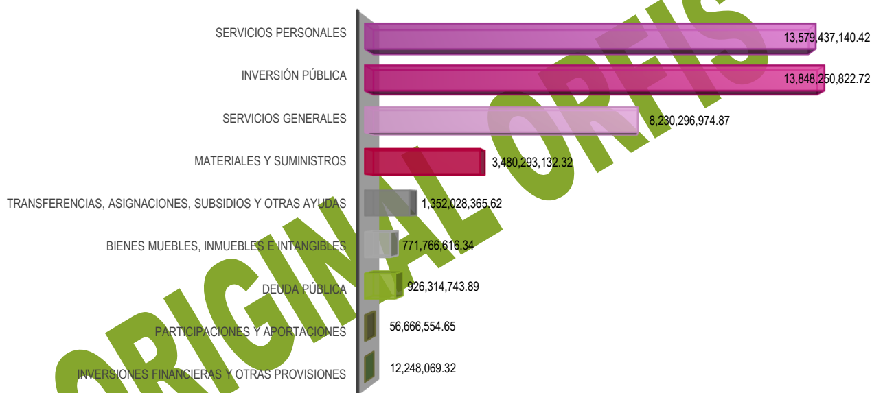
Gráfica Número 4: Egresos Devengados Municipales 2024