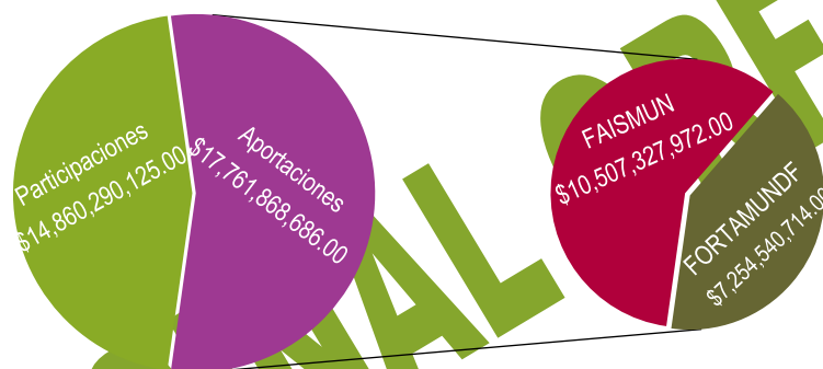
Gráfica Número 2: Participaciones (Ramo 28) y Aportaciones Federales (Ramo 33)

Fuente: Gaceta Oficial del Estado Número Extraordinario 046 y 068 de fechas 31 de enero de 2024 y 15 de febrero de 2024, respectivamente.